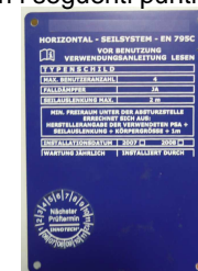
Esempio di marcatura di dispositivo di ancoraggio

Prima dell'utilizzo il dispositivo di ancoraggio è da sottoporre a verifica a vista, per accertare le mancanze palesi p. e. fissaggio delle viti, stato di usura, ruggine ecc.